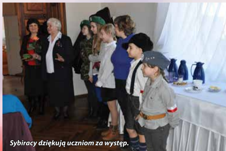
Sybiracy dziękują uczniom za występ.