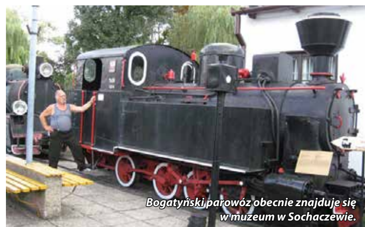
Bogatynski parowóz obecnie znajduje się w muzeum w Sochaczewie.