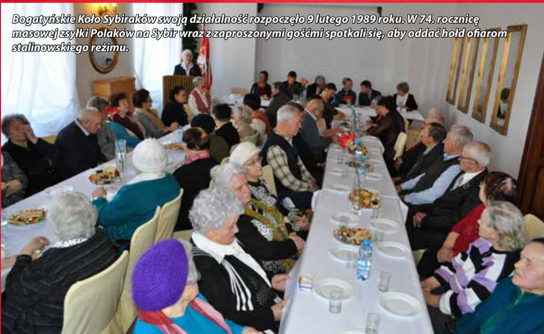
Bogatyńskie Koło Sybiraków swoją działalność rozpoczęło 9 lutego 1989 roku. W 74. rocznicę masowej zsyłki Polaków na Sybir wraz z zaproszonymi gośćmi spotkali się, aby oddać hołd ofiarom stalinowskiego reżimu.