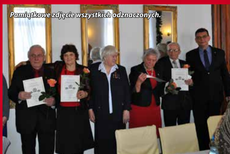
Pamiątkowe zdjęcie wszystkich odznaczonych.