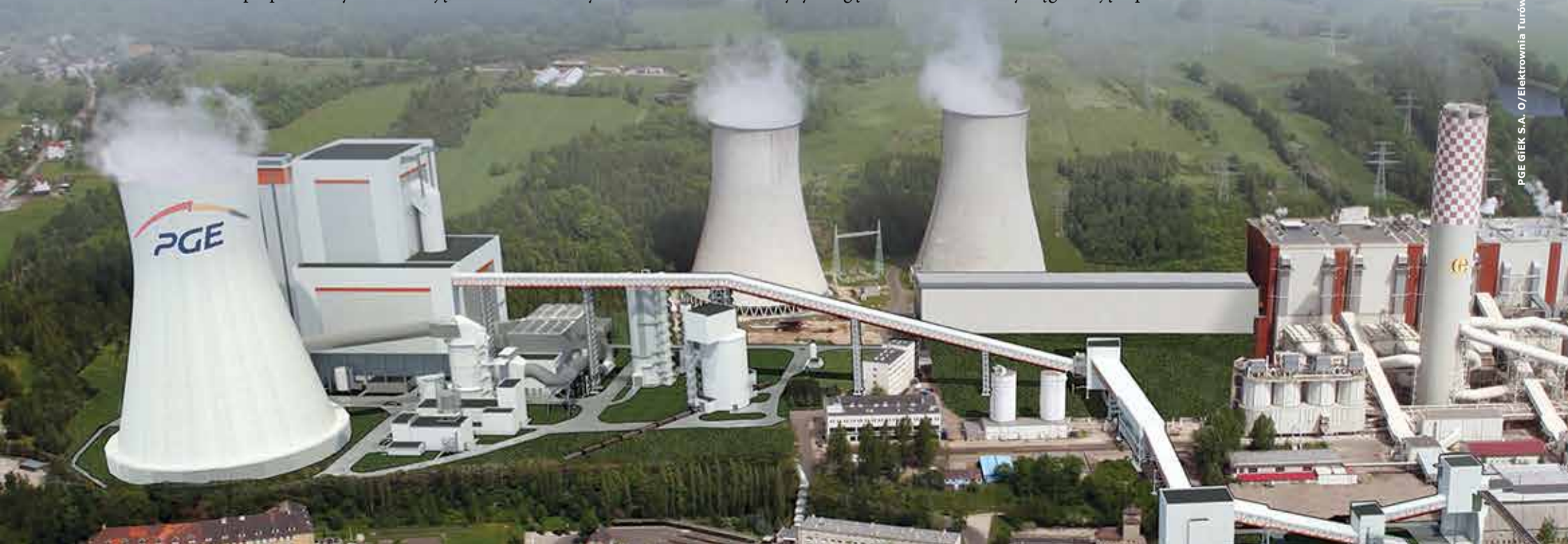
PGE GiEK S.A. / Elektrownia Turów

Do tematu powrócimy w kolejnym wydaniu Biuletynu. Walne Zgromadzenie Akcjonariuszy PGE GiEK S.A. wznowi obrady 14 marca br.