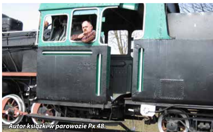
Autor książki w parowozie Px 48.