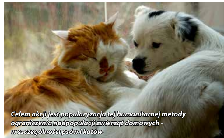
Celem akcji jest popularyzacja tej humanitarnej metody ograniczenia nadpopulacji zwierząt domowych - w szczególności psów i kotów.